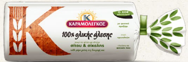
100% Ολικής Άλεσης